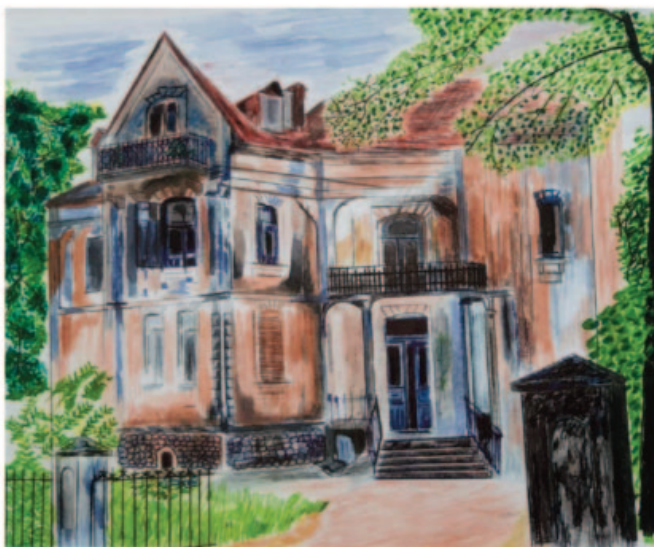
Kuća Vujovića, kombinovana tehnika, 15x20 cm, 2020